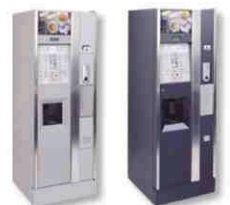
Coloris standard série Antares.

COMPANIES WITH CERTIFIED QUALITY SYSTEM UN EN ISO 9001:94