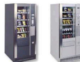
Coloris standard série Vega 700.